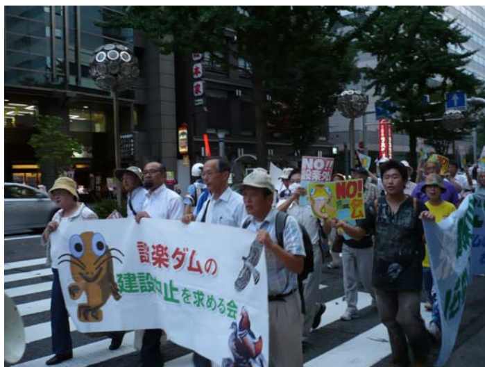
(名古屋広小路を歩く参加者)

5時からのデモは参加者が60名を越え、名古屋駅から栄まで広小路通りを堂々と1時間以上にわたり行進し、思いを十二分に訴えることができました。参加者からは「久しぶりにデモに参加しスッキリした」・「また栄・三越前でデモを見たという方からは、「名古屋のメインストリートでデモなんてよくできたね、元気が出た、よかった」と感想を頂きました。皆さん、今後はよりいっそう！設楽ダムの建設中止を目指し、共に進もうではありませんか！！