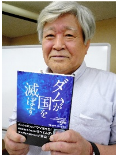
著書「ダムが国を滅ぼす」と今本博健さん＝大阪市北区

国の諮問機関・淀川水系流域委員会の元委員長で、ダム計画を「ダム偏重」として批判している今本博健(ひろたけ)・京大名誉教授(72)＝京都市左京区＝が、全国のダム問題について記した初の著書「ダムが国を滅ぼす」(扶桑社)を出版した。「週刊SPA!ダム取材班」との共著となる。